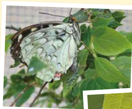
産卵 ミドリ色の卵を産むよ。