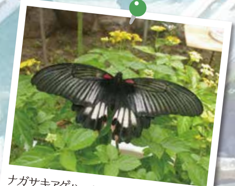
ナガサキアゲハ アゲハの中でも大きな種類です。

自然楽習園では、自然に近い状態でチョウを観察することができるように、外の気温に近い温度にしております。あたたかい春から夏にかけては、咲きほこる花のまわりを乱舞するチョウが見ごたえ抜群です。寒い時期には、成虫で越冬しているタテハモドキ、木枝や葉っぱにそっくりなサナギたちなど、間違い探し気分で見つけてみるのもおすすめです。