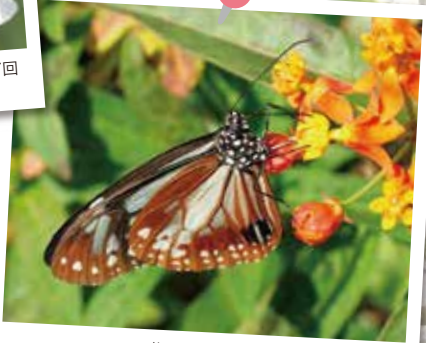
アサギマダラ 旅をするチョウとして有名です。ゆっくりフワフワとぶので見つけやすいです。