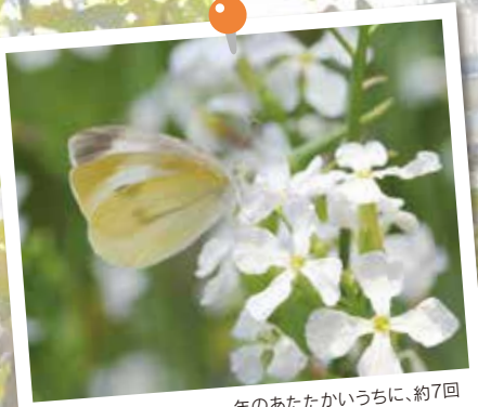
モンシロチョウ 一年のあたたかいうちに、約7回も世代交代をします。