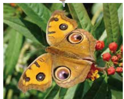
タテハモドキ 夏の成虫と秋の成虫は、翅の模様 はな が違います。

自然楽習園では、自然に近い状態でチョウを観察することができるように、外の気温に近い温度にしております。あたたかい春から夏にかけては、咲きほこる花のまわりを乱舞するチョウが見ごたえ抜群です。寒い時期には、成虫で越冬しているタテハモドキ、木枝や葉っぱにそっくりなサナギたちなど、間違い探し気分で見つけてみるのもおすすめです。