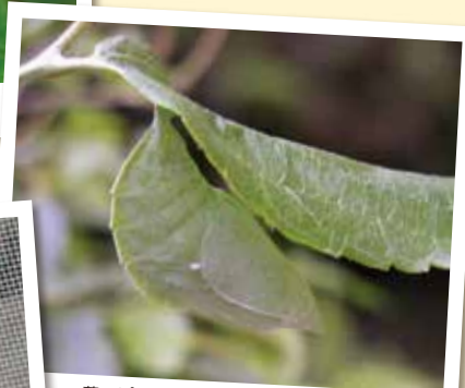
葉っぱそっくりに変身しているので、"さなぎ" 見つけるのがむずかしいよ。