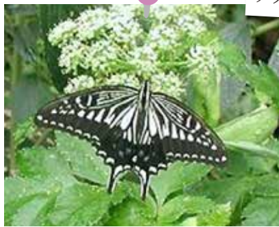
アゲハ 春の成虫と夏の成虫は、大きさが違います。