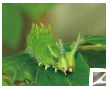
幼虫 つのがはえていて、かわいい顔をしているよ。