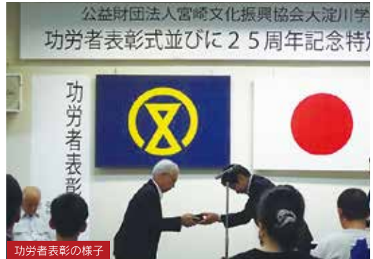
功労者表彰の様子