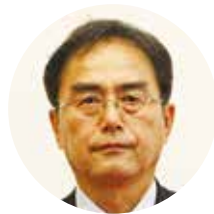
みやざき歴史文化館 館長

このような環境の中、館では観覧者の皆様が郷土の考古・歴史・民族・芸能、日向神話等を楽しく学習する場を提供する常設