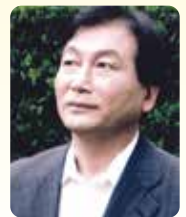
台本・演出 地村俊政

創作ジュニア・ミュージカル「海幸と山幸」は宮崎の神話をベースに、いろいろなエピソードを交えて、50人以上の子どもたちや大人が楽しく歌い、踊り、演じます。海幸と山幸の時代へタイムスリップしてみよう!