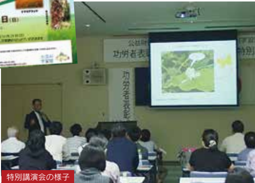
特別講演会の様子