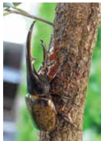
ヘラクレスオオカブト

マレー半島および大スンダ列島の高標高地に生息。ロシア南西部のコーカサス地方に生息しているわけではありません。