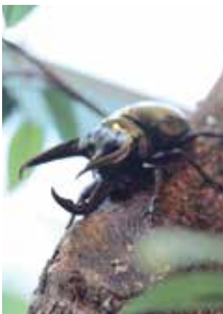
コーカサスオオカブト

日本をはじめ、広範囲な東アジアに生息。温暖で湿度の高い環境を好むため、宮崎市近郊でよく見られる種類のひとつです。