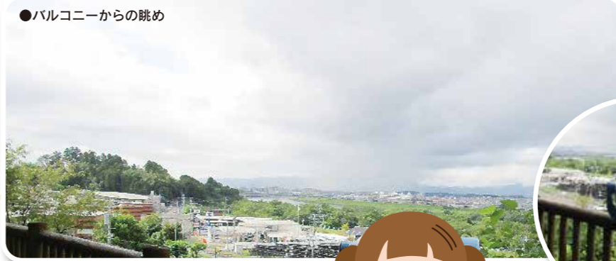
●バルコニーからの眺め