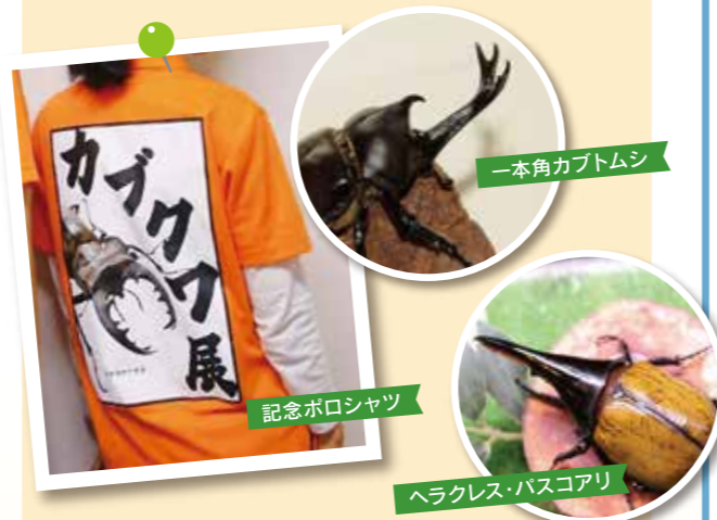
一本角カブトムシ