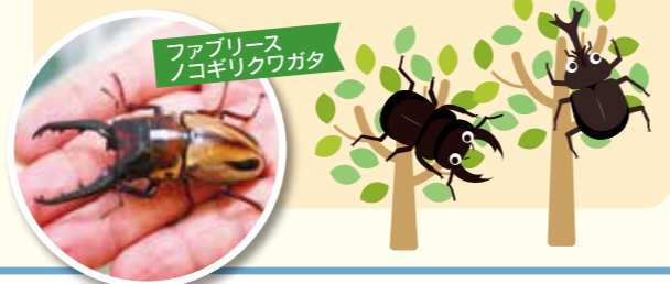
ファブリースノギリクワガタ

毎年夏に開催している「カブ・クワ展」は今年も大好評で閉幕しました。今年は25周年記念ということで、約25種の生きたカブトムシ・クワガタムシと、数多くの標本を展示しました。大人気の定番「ヘラクレスオオカブト」や、ツノの形が特殊な宮崎県産「カブトムシ」、そして赤や緑の色鮮やかな「ニジイロクワガタ」は特に注目を集めました。開催中、子どもたちはもちろん大人の方もムシに驚く姿が見られ大変賑わいました。