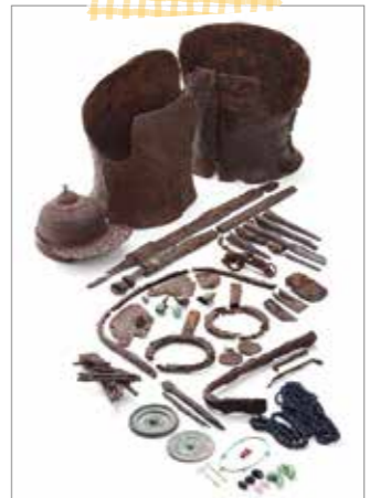
下北方5号地下式横穴墓出土品 ●展示室2

NEW! 今年度は国の重要文化財に指定される「下北方5号地下式横穴墓出土品」をテーマに展示します