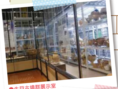
●生目古墳群展示室