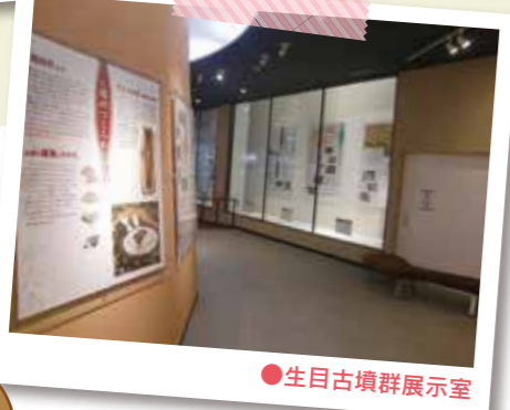
●生目古墳群展示室

図書資料室 調査研究・整理室 事務室 受付 図書コーナー 授乳室 トイレ 入口 バス停