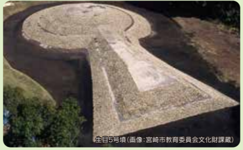
生目5号墳

生目古墳群は、昭和18年に国の史跡指定を受けた約50基からなる古墳時代前期を代表する古墳群です。その特徴は、前方後円墳が日本列島で作られ始めてまもない4世紀という早い時期に造られた100mを超える大型の前方後円墳が3基もあること、南九州にしかない墓制である地下式横穴墓を多数有し、主体部になっている前方後円墳もあること、さらに特徴的な埴輪が出土していることがあげられます。散策しながら、築造当時の状態に復元された5号墳や九州最大の前期古墳である3号墳など、墳丘に上ることのできる史跡公園として整備されています。 平成30年5月には「南九州の古墳景観」というストーリーで、宮崎県初、また、古墳だけを対象としたものとして、全国初めての日本遺産に認定されました。