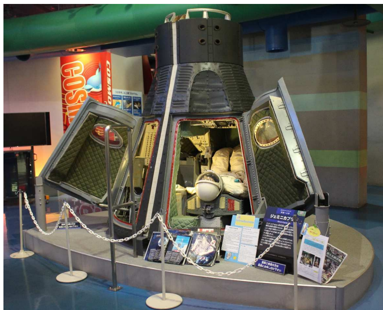
【ジェミニカプセル】