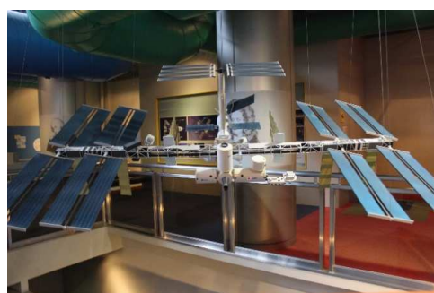
【ISS(国際宇宙ステーション)】