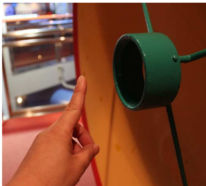
【パラボラアンテナ 音の集まる部分】