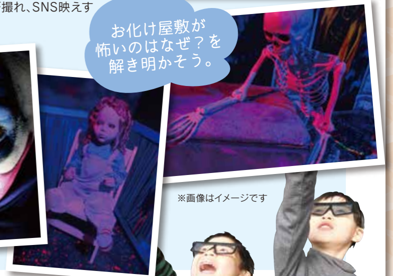
※画像はイメージです