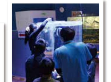
▲大淀川学習館での様子 ◀宮崎市民プラザでの様子