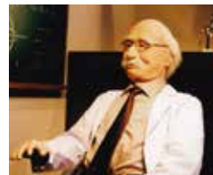
コスモ博士 (ロボット)