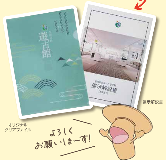
オリジナルクリアファイル