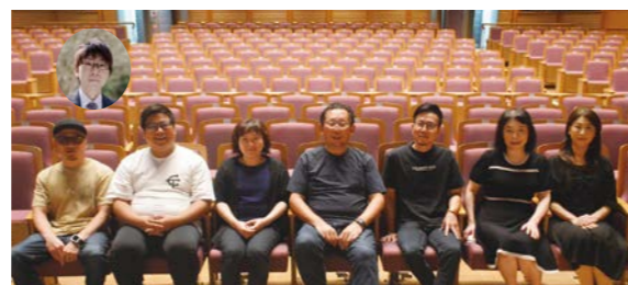
市民プラザコンサート実行委員のみなさん

宮崎にも素晴らしい演奏家やアーティストがいることを、多くの市民の方々に知っていただきたいという目的のもと、スタートした市民プラザコンサートですが、これまでに64組の演奏家・アーティストにご出演いただき、たくさんの方の来場者数を動員しました。当初の目的が達成されたことから、今回をもって終了することとなりましたが、単なる「終わり」ではなく、次への新たな「始まり」でもあります。市民プラザでは、今後も多彩で魅力的な事業を展開していきますので、どうぞご期待ください!