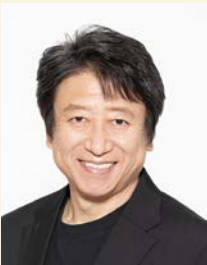
代表作 ●NARUTO -ナルト- (はたけカカシ) ●夏目友人帳 (ニャンコ先生/斑)