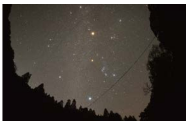
境川中流 (宮崎市高岡町)