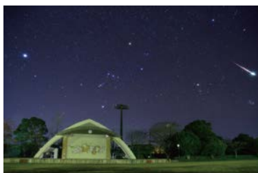
田野運動公園 (宮崎市田野町)