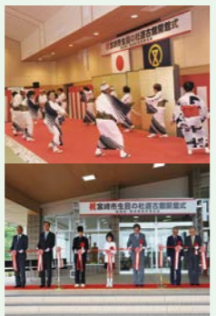
開館記念イベント