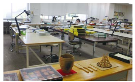
調査研究・整理室