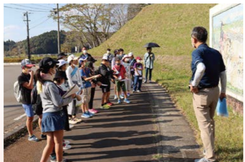
レッツ!タイムワープ

しました。体験は、手作りなどのアナログな部分を大切に、親子で楽しめる講座を続けていきたいですね。また、「昨年からのレッツ!タイムワープ」という事業がスタートしています。小学4年生～6年生向けに年間を通して行う体験事業で、農耕体験や日本文化体験などを通して学校や学年を超えた友達ができるのも魅力です。年に1回募集がありますので、こちらもチャレンジしていただきたいと思いますね。