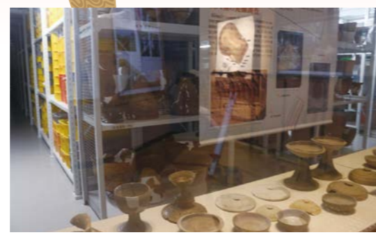
展示室4から収蔵庫を見る