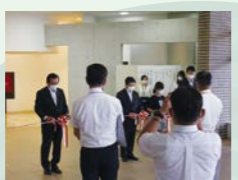
展示室リニューアルオープン